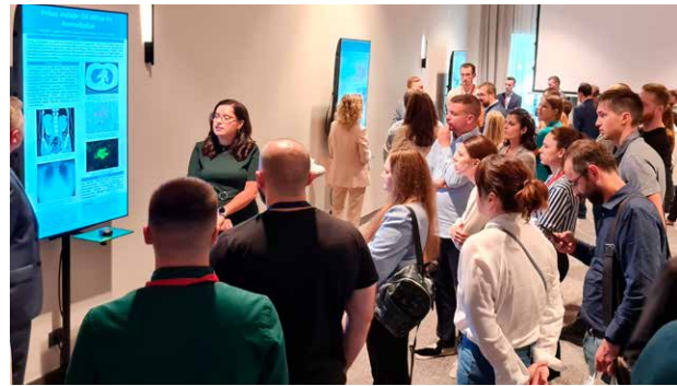
Sudionici su prikazali znanstvene i stručne radove na dvije poster-sekcije, ukupno 53 originalna rada

postoji subspecijalizacija koja se bavi samo intervencijama u nefrologiji. Sudionici skupa su se složili da bi svaki nefrolog morao znati postaviti netunelirani centralni venski kateter, ali i biopsiju bubrega, što i jest u opisu specijalizacije iz nefrologije.