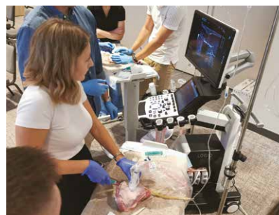
Učenje tehnike postavljanja centralnih venskih katetera uz kontrolu ultrazvuka