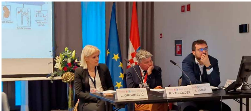
Stručni program kongresa započet je tematskom sekcijom o primjeni OMICS tehnologija u nefrološkim istraživanjima i kliničkoj praksi

Na jubilarnom kongresu Hrvatskog društva za nefrologiju, dijalizu i transplantaciju sudjelovala su 92 predavača, moderatora i panelista iz zemlje i inozemstva. Više od 300 sudionika tijekom četiri dana sudjelovalo je na 70-ak predavanja, okruglih stolova, pro et contra rasprava, poster-sekcija, plenarnih i sponzoriranih predavanja te su razmijenili znanja i iskustva o područjima tubulointersticijskih i glomerularnih bolesti, akutnoga bubrežnog oštećenja i kronične bubrežne bolesti kao i metodama nadomještanja bubrežne funkcije. Kongres bio prilika i za obilježavanje 30 godina Hrvatskog društva za nefrologiju, dijalizu i transplantaciju. U sklopu kongresa održan je i 6. simpozij Hrvatske udruge nefroloških medicinskih sestara i tehničara