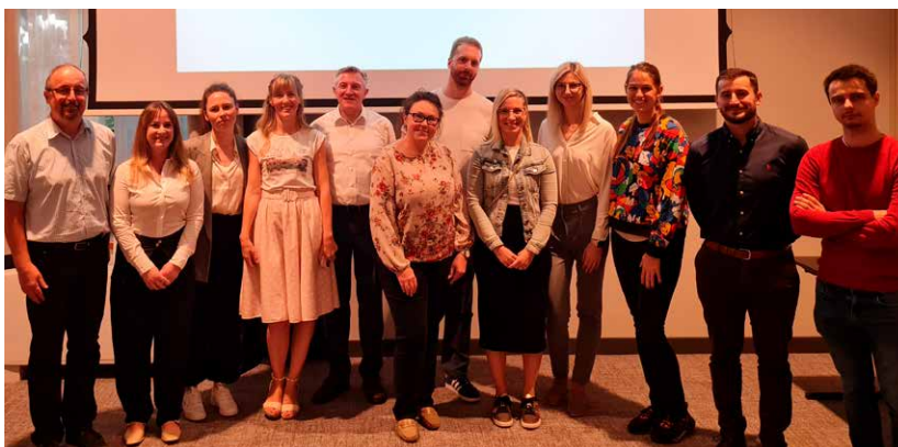
Sudionici praktične radionice biopsije bubrega