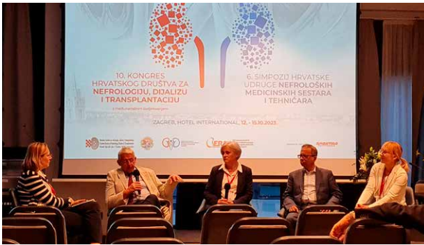
Iskustva s bolesnicima na kućnoj dijalizi pokazala su veću kvalitetu dijalize, manje komplikacija i neupitno bolju kvalitetu života bolesnika